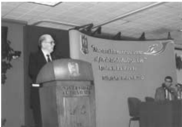
Lyndon H. LaRouche dicta una conferencia durante su reciente visita a México.

cha gente de la población pensó que por ahí iba la cosa. Pero resulta que la cosa va en dirección contraria y, además, rápidamente. Yo me concentraría en construir la capacidad, aunque sea a escala limitada, para luego prepararse para expandirla. Porque debe haber un cambio de la administración en las áreas de producción. Cualquier persona que sea buen ingeniero puede ser un buen gerente.