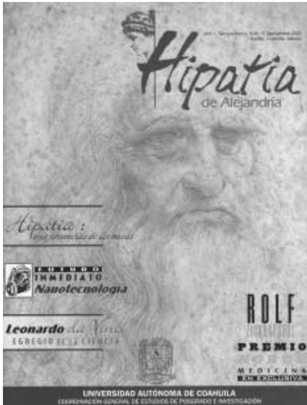
Portada del primer número de la revista Hipatia, de la Universidad Autónoma de Coahuila en México.

donde la ciencia es el motor, se desarrollan cuadros que pueden funcionar con esa orientación. En consecuencia, hay un potencial ilimitado, incalculable, para el desarrollo.